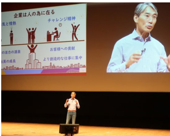
蒲田会場の様子を全国にオンライン配信

また、入社式が6月に延期になり、在宅でオンライン研修を受講する新入社員は自宅から参加する等、オンラインでの実施は、外出自粛やテレワーク等の行動制限がある中、より身近で、より多くの社員の参加を実現可能にしました。結果として、例年よりイベントへの参加者が増加し、日本全国、海外にも展開するグループの一体感を今まで以上に高めることができたとも言えます。