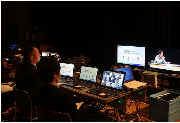
ステージ裏で画面切り替えや接続状況を確認

容量の大きな動画コンテンツは、表示に遅延が発生する場合もあるため、ファイルサイズを制限する等、ネットワーク環境や接続数に応じ、コンテンツを調整することも必要になります。