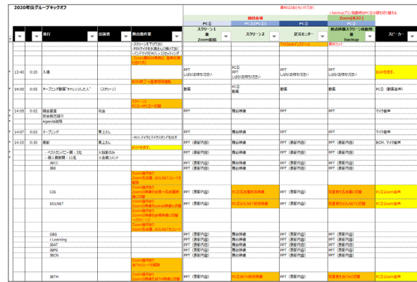
進行管理表を作成し、各場面での作業を可視化