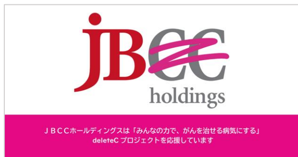
「#deleteC 大作戦」 J B C Cホールディングス投稿用ロゴ画像

2人に1人ががんになるという社会全体の課題に対し、誰もが参加できる方法で、がんを治せる病気にすることを目指すdeleteCの活動趣旨に賛同しました。J B C Cホールディングスは、IT企業として常に新たなテクノロジーに挑戦し、誰もが輝ける、躍動する社会を創り出すことをグループビジョンとしています。SNSを通じて一人でも多くの方に活動を知っていただき、誰もが気軽に参加できるよう、この活動を応援していきます。