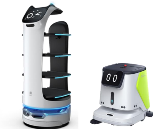
配膳ロボット「BellaBot」(左) と自動清掃ロボット「PUDU CC1」(右)

J Bサービスは、24 時間 365 日体制の運用センターをはじめ全国に 43 のサービス拠点をもち、サービスロボットに限らず、商業施設やアミューズメント施設、オフィス、医療機関、物流倉庫、スーパー、飲食店など、様々な分野で利用される業務用機器の導入・運用・保守サービスをメーカーや販売代理店様に代わって提供しています。これらの実績とマルチベンダーに対応した技術力、全国規模のサービスネットワークが評価され、PUDU と認定保守パートナー契約の締結に至りました。